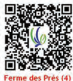
Ferme des Prés (4)